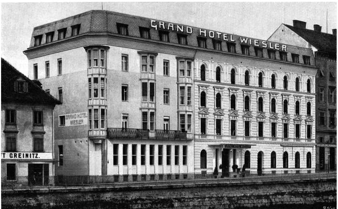
Grand Hotel Wiesler 1909 (Wikimedia)